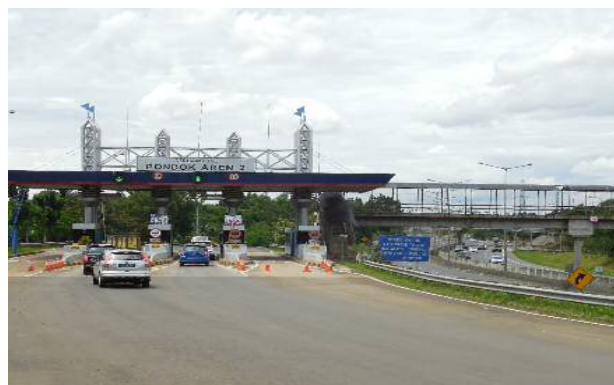
ポンドック アレン料金所(下り線)